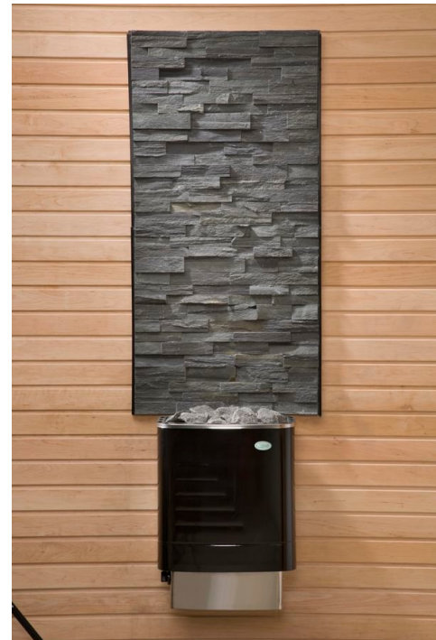
Yllä: verhoilukivielementti Alla: kiukaantaus ja verhoilukivielementti